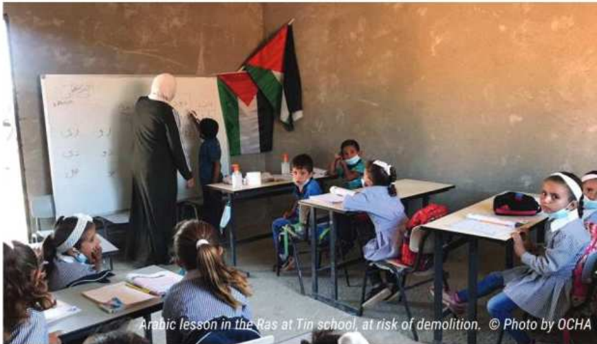
Arabic lesson in the Ras at Tin school, at risk of demolition.