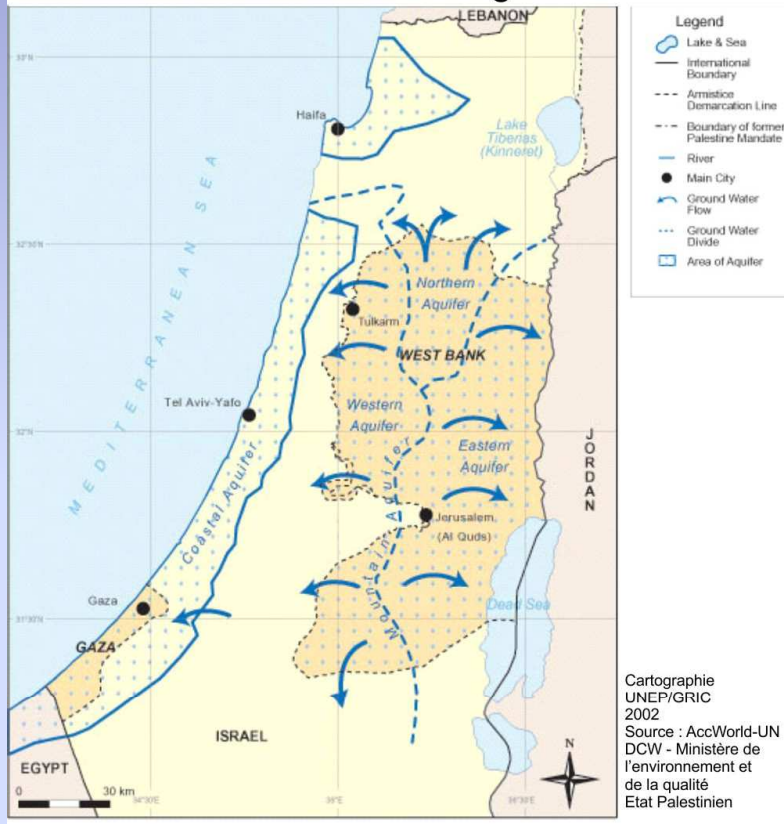
Les nappes phréatiques costières et en montagne